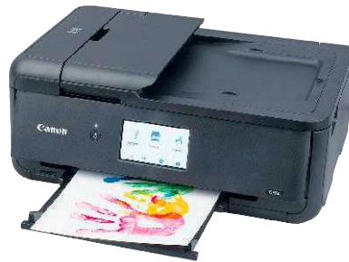
2 Canon Pixma TS9550