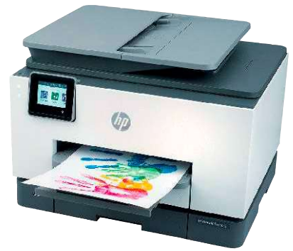
3 HP Officejet Pro 9022