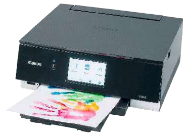
6 Canon Pixma TS8350