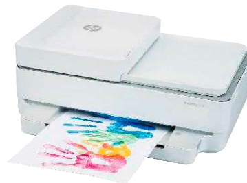
14 HP Envy Pro 6420