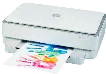
13 HP Envy 6020