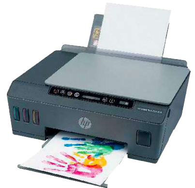
9 HP Smart Tank Plus 555