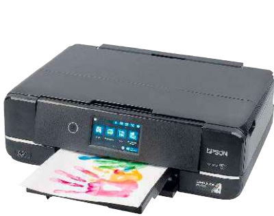
4 Epson Expression Photo XP-970