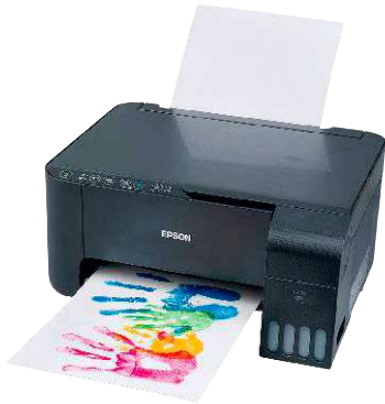
10 Epson Ecotank ET-L3150