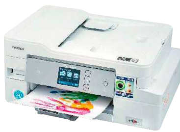
11 Brother MFC-J1300DW