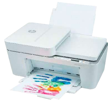
12 HP Deskjet Plus 4120 →