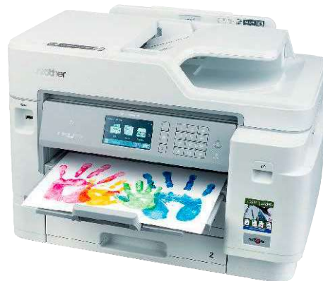
8 Brother MFC-J5945DW