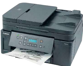
16 Canon Pixma GM4050