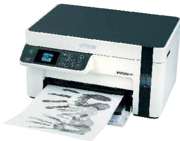
15 Epson Ecotank ET-M2120