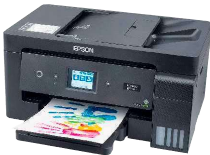
7 Epson Ecotank ET-15000