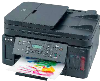
1 Canon Pixma G7050