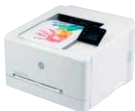
HP Color Laserjet Pro 255dw