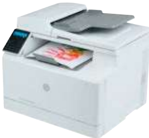
HP Color Laserjet Pro MFP M183fw