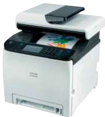
Ricoh M C250FWB