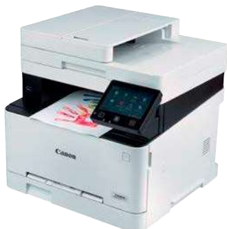
Canon i-Sensys MF643Cdw