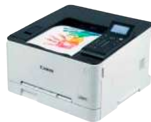
Canon i-Sensys LBP623Cdw

Noch mehr Drucker. Testergebnisse für mehr als 160 Geräte finden Sie unter test.de/drucker . Darunter auch Tinten-drucker, die bessere Fotos und Farbseiten schaffen als die aktuellen Laser.