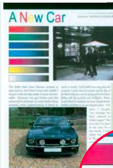
Farbdruck. Viele drucken Farbverläufe unregelmäßig – hier der Brother HL-L3230CDW.