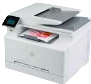
HP Color Laserjet Pro MFP M283fdw