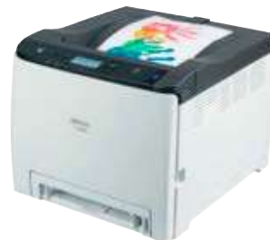
Ricoh P C300W