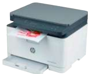
HP Color Laser MFP 178nwg