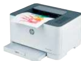
HP Color Laser 150nw