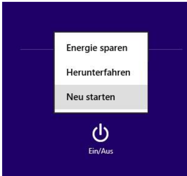
Windows 10: UEFI öffnen (Bild: Screenshot)