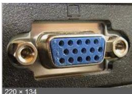
Der Stecker so

Die älteste und schlechteste Variante weil analoge Technik ist VGA Die Buchse dazu sieht so aus: