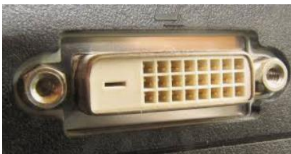
Der Stecker so

Dann gibt es das digitale DVI Die Buchse dazu sieht so aus: