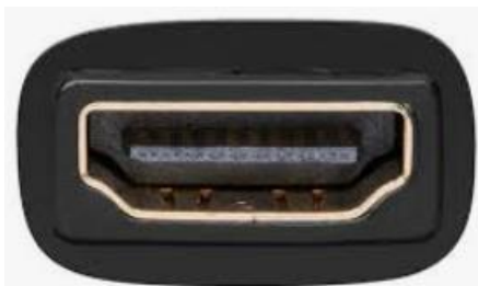
der Stecker so

Und das Beste mit Tonübertragung HDMI Die Buchse dazu sieht so aus: