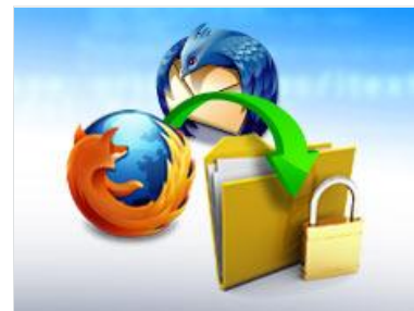
MozBackup: Datensicherung für Firefox und Thunderbird.